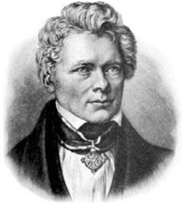
FRIEDRICH WILHELM JOSEPH VON SCHELLING

Cosmovisão nasce da interação do indivíduo com as experiências na vida (percepção sensível).