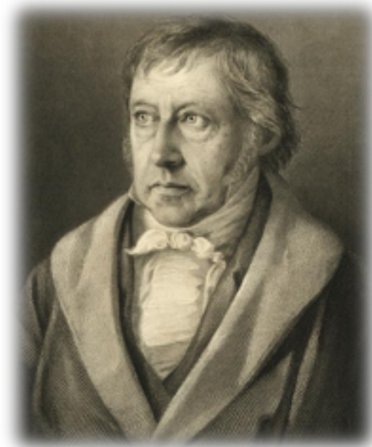
GEORG WILHELM FRIEDRICH HEGEL

A visão de uma nação em uma determinada época, com participação especial dos poetas e artistas