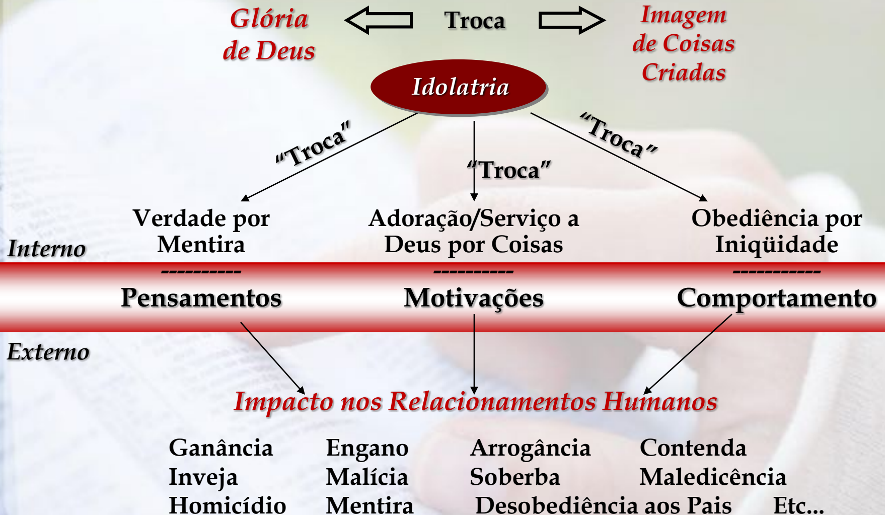
Diagrama de Rm 1:21-32