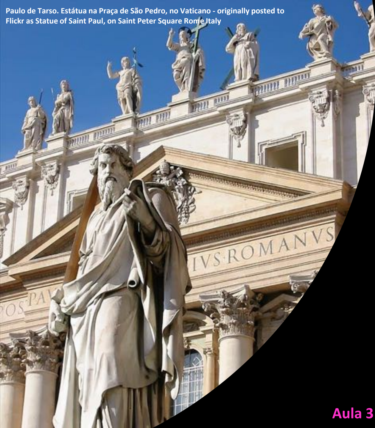
Paulo de Tarso. Estátua na Praça de São Pedro, no Vaticano - originally posted to Flickr as Statue of Saint Paul, on Saint Peter Square Rome Italy

Paulo – um homem, semelhante a nós, que enfrentou com coragem e graça o status da sua época