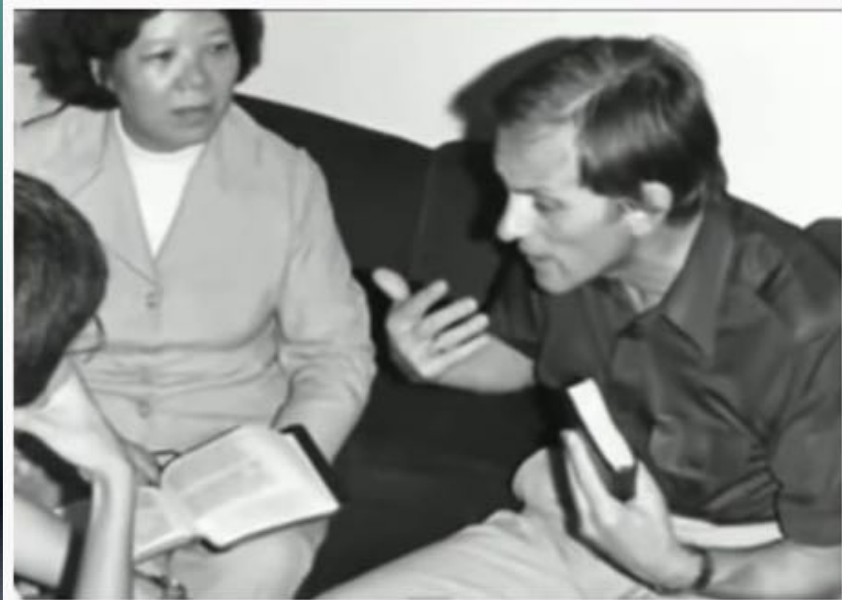
O Contrabandista de Deus - Irmão André

“Senhor, fizestes cegos enxergar, por favor cega os olhos dos que vem”