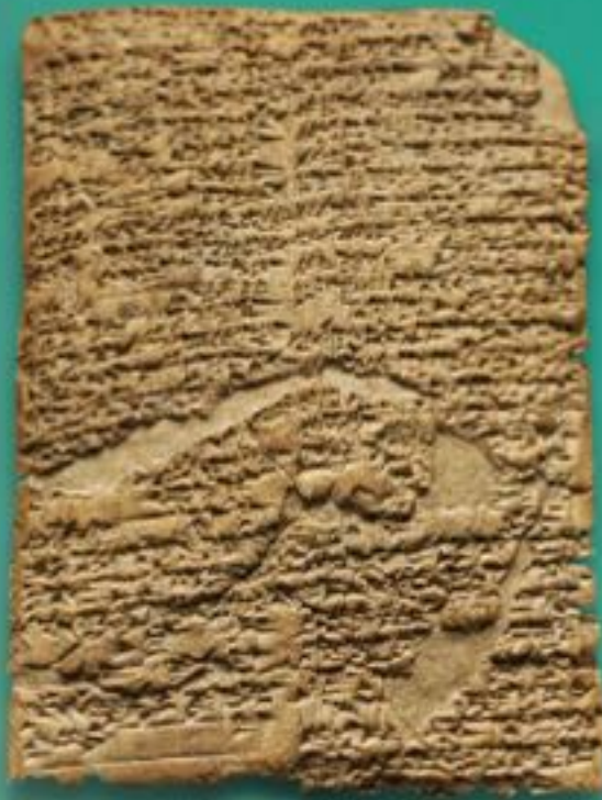
Código de Hammurabi

196. Se um awilu cegar o olho de um awilu , seus olhos serão cegados