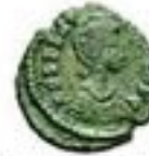
Aes 383-400 CE 0.5-1.5g, ~14mm