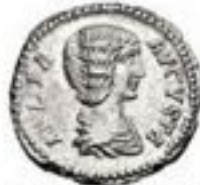
Denarius 211 BCE-241 CE 3g, ~19mm