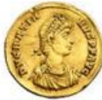
Solidus 310-693 CE 4.5g, ~20mm