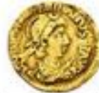
Tremissis 380-367 CE 1.5g, ~14mm