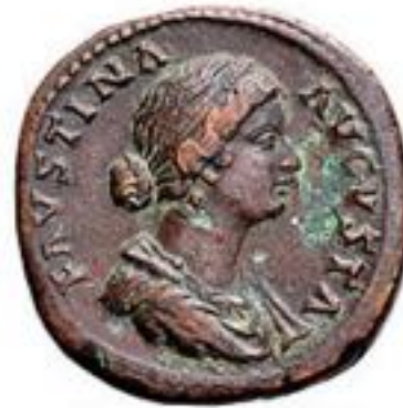
Sestertius 23 BCE-250 CE 20-30g, ~35mm