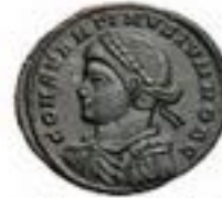
Aes 315-400 CE 2-4g, ~18mm