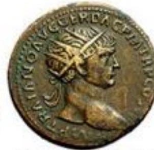
Dupondius 23 BCE-250 CE 11-15g, ~29mm