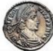
Siliqua 310-650 CE 1-3g, ~18mm