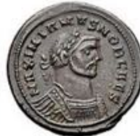
Follis 294-310 CE 5-12g, ~26mm (early)