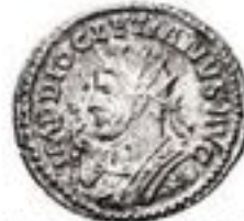
Antoninianus 215-295 CE 5-5g, ~21mm