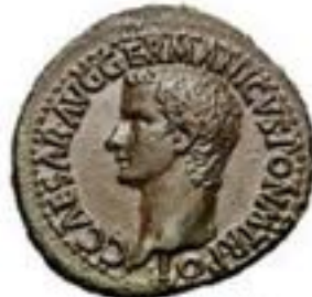
As 280 BCE-250 CE 9-12g, ~27mm