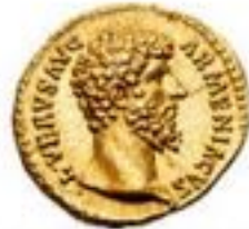
Aureus 200 BCE-305 CE 7g, ~20mm