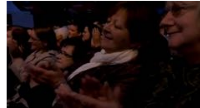
Celtic Woman - Amazing Grace http://www.youtube.com/watch?v=HsCp5LG_zNE