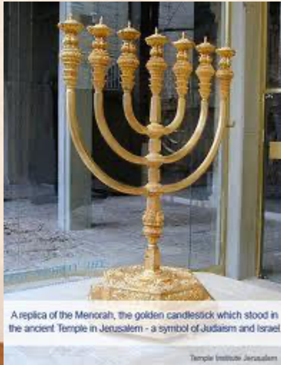
A replica of the Menorah, the golden candlestick which stood in the ancient Temple in Jerusalem - a symbol of Judaism and Israel.