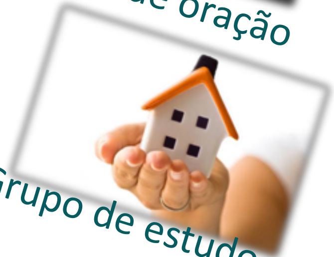
Grupo de estudo