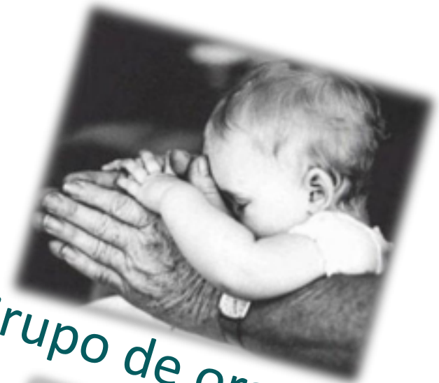
Grupo de oração