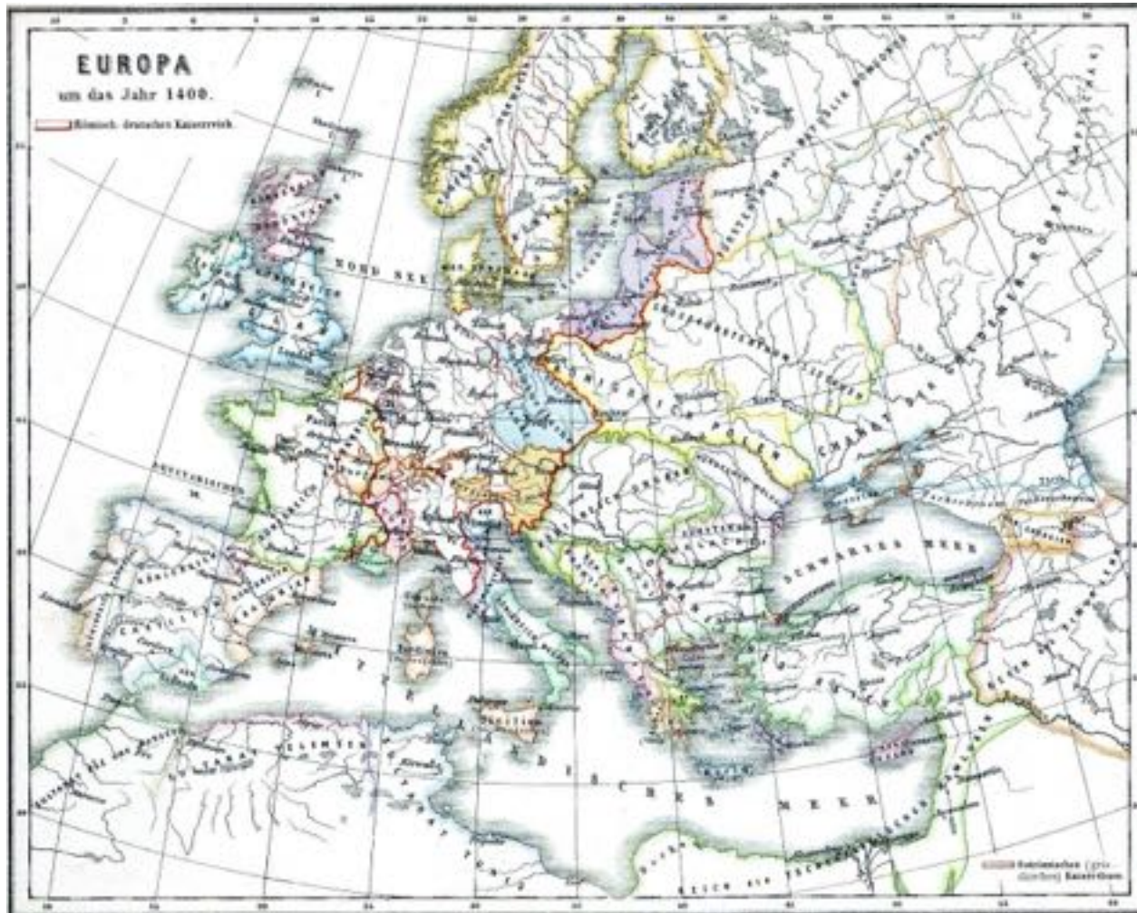
Figura de domínio público baixada do site da wikipedia em 8/12/14