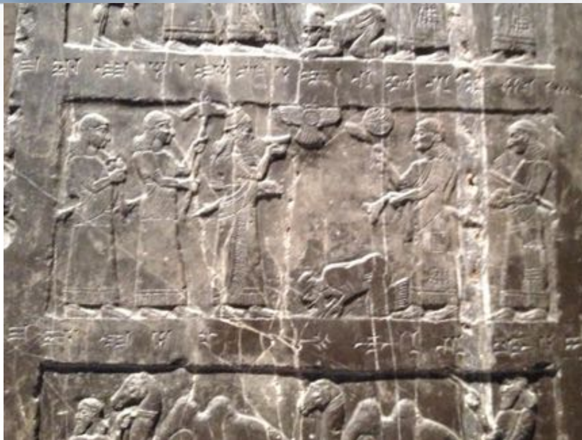
Imagem de Jeú no Obelisco Negro