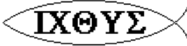
Figura 1 - O peixe como símbolo cristão

O peixe foi usado como símbolo cristão, pois ichthus (peixe em grego) é um _____ para “Jesus Cristo, Filho de Deus, Salvador”.