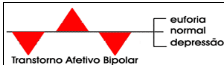
Figura acima : Episódios Depressivos coexistindo com Episódio ou Episódios Eufóricos . Entre os episódios a grande maioria volta ao normal. O intervalo entre os episódios tende a diminuir com a idade.

“ em algum ponto de sua história passa por um período de humor excepcionalmente elevado “