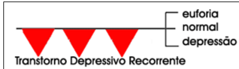
Figura acima : Episódios Depressivos (▲) com volta à normalidade entre os episódios.

-Freqüentemente a pessoa pode pensar muito em morte, em pessoas que já morreram, ou na sua própria morte. Desejo suicida presente, às vezes com tentativas de se matar, achando ser esta a " única saída " ou para " se livrar " do sofrimento, a pessoa culpa-se, sentindo-se inútil ou um peso para os outros .