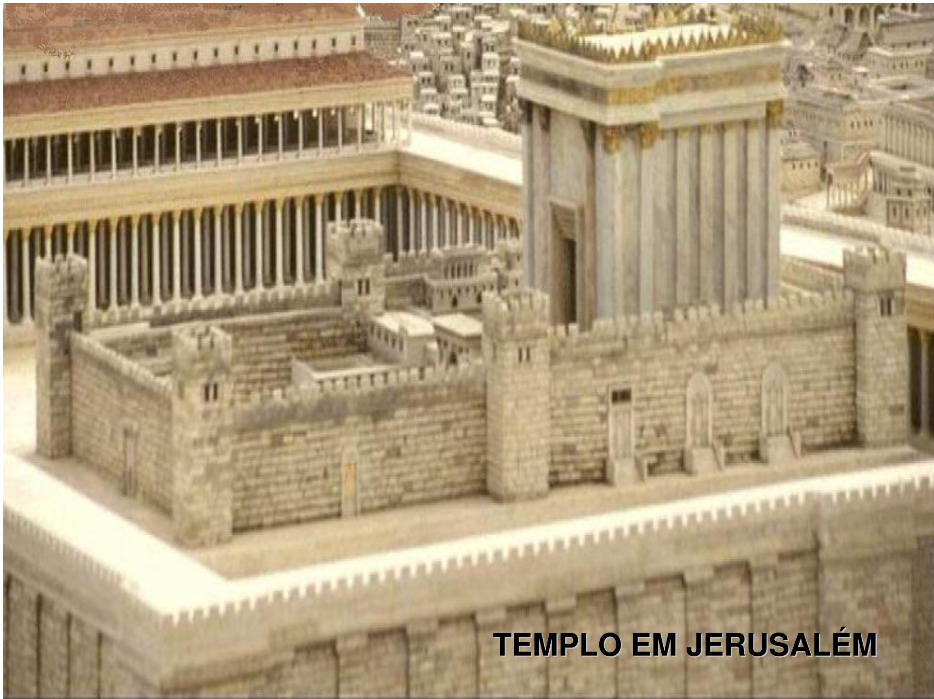
TEMPLO EM JERUSALÉM